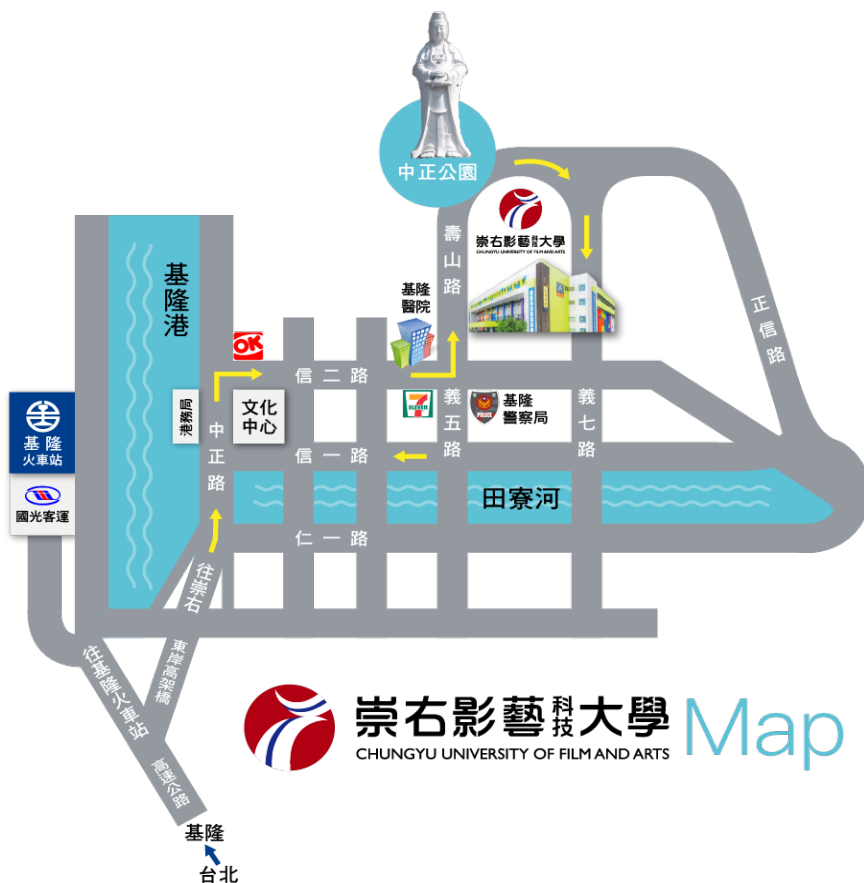
附件 8：崇右影藝科技大學位置圖