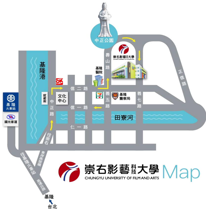
附件 9：崇右影藝科技大學位置圖